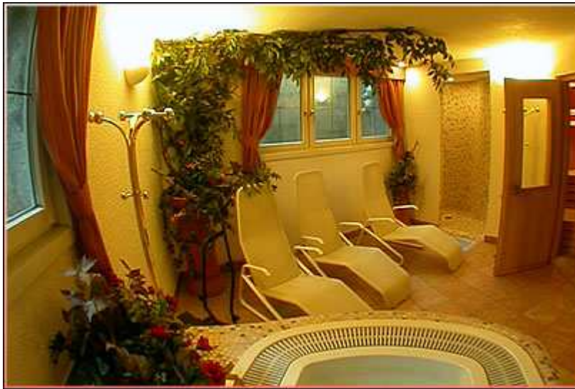
Hoetel Cassana, Sauna

Apres-Ski wird in Livigno groß geschrieben. Auf den Pisten gibt es gemütliche Einkehrmöglichkeiten und auch im Ort kann man den Einkehrschwung üben. In der Nähe des Hotels sind mehrere Ski- und Skischuhverleihe, im Ort gibt es eine große Anzahl von Sportgeschäften.