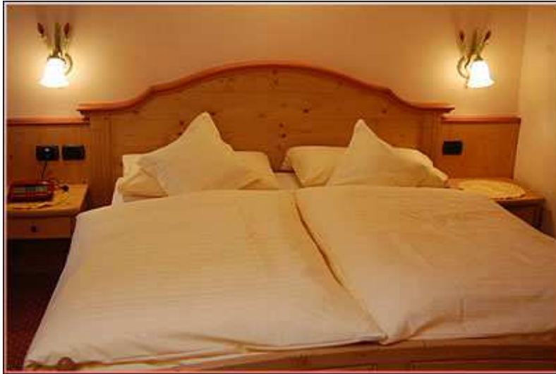
Hotel Cassana, Zimmerbeispiel